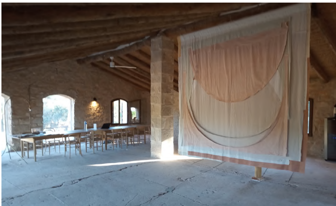
Neuer Degustierraum im Dachgeschoss der Casita.